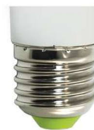
Цветовая температура: 4000K Артикул: 25511