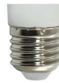
Цветовая температура: 6400K Артикул: 25512