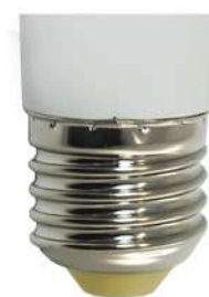
Цветовая температура: 2700K Артикул: 25510